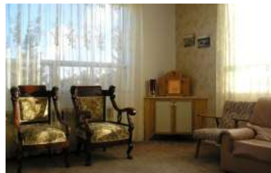
Nouvelle chapelle au presbytère de la paroisse St-Paul de Senneterre.

L'inauguration de cette nouvelle chapelle a eu lieu en novembre 2011. »